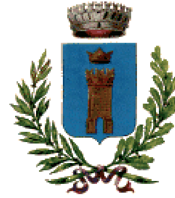
Comune di Ceglie Messapica